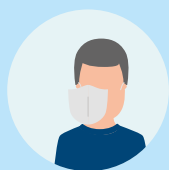
Alltag mit Maske